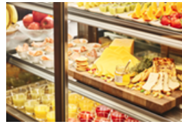
コールドセレクション