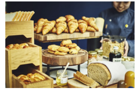
ベーカリーセレクション