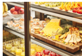
コールドセレクション